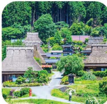
일반사단법인 난탄시 미산 관광 마을 만들기 협회

전통 기법이 담긴 가야부키 지붕의 가옥이 남아있는 집락. 아름다운 자연에 둘러싸인 일본의 원풍경을 바라볼 수 있으며 시간이 천천히 흘러갑니다. <오시는 길> JR 산인선 '히요시역'에서 버스로 약 60분